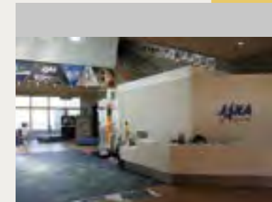
宇宙科学技術館内の案内窓口