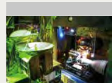
宇宙科学技術館の展示例②

種子島宇宙センターの施設についてや、見学案内、宇宙科学技術館についてなどは、下記の二次元バーコードを読み込み、リンク先をご覧ください。