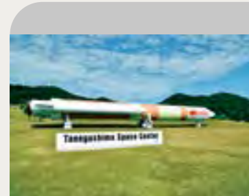
HII ロケット実物大模型

総面積約 970 万平方メートルにもおよぶ日本最大のロケット打ち上げ施設です。南種子町東南端の海岸線に面しており、「世界一美しいロケット発射場」とわれています。センター内には、「大型ロケット発射場」「衛星組立棟」「衛星フェアリング組立棟」などの設備があり、人工衛星の最終チェックからロケットへの搭載、ロケットの組み立て・整備・点検・打ち上げ、打ち上げ後のロケットの追跡まで一連の作業を行っており、日本の航空宇宙開発において人工衛星打ち上げの中心的な役割を果たしています。