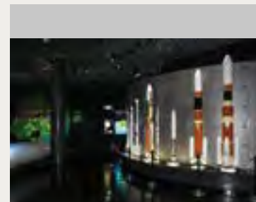
宇宙科学技術館内の展示例①