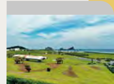
管理棟側からの景観