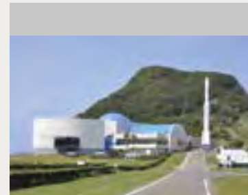
宇宙科学技術館の外観