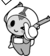
南種子町マスコット 宙太(ちゅうた)くん