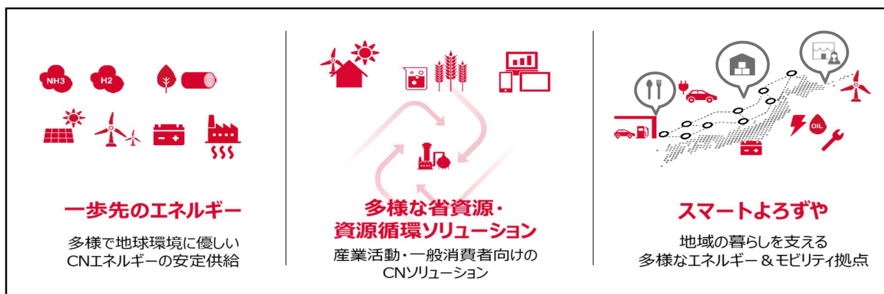
出光興産 事業ポートフォリオ転換に向けた 3 つの事業領域

出光興産は 2050 年カーボンニュートラル社会の実現に向け、2030 年ビジョン「責任ある変革者」、2050 年ビジョン「変革をカタチに」を掲げています。昨年 11 月に発表した 中期経営計画 （対象年度：2023～2025 年度）では、下記「3 つの事業領域」の社会実装を通して「人々の暮らしを支える責任」と「未来の地球環境を守る責任」を果たします。