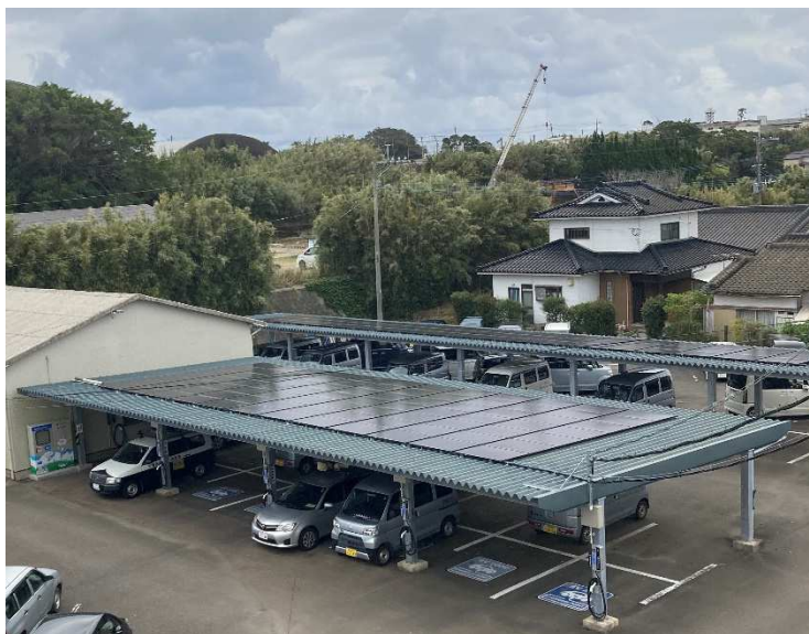
南種子町役場に設置された屋根置き太陽光パネル （オンサイトPPA）

※1 オンサイトPPA：Power Purchase Agreement（電力販売契約）の一種で、PPA事業者所有の太陽光発電設備を使用者の敷地や事務所・工場などの屋根に設置し、電力を供給するもの。