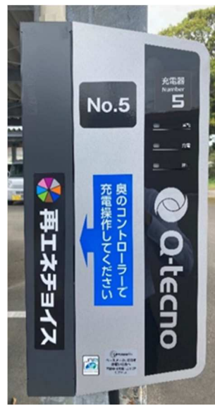
「再エネチョイス」を搭載した EV充電器

南種子町は2022年9月に「 南種子町ゼロカーボンシティ宣言 」を行い、2050年までに温室効果ガス（CO 2 ）の排出量を実質ゼロにする「ゼロカーボンシティ」を目指すことを表明しました。今回の共同実証はその取り組みの一環であり、南種子町役場の敷地内に太陽光発電パネルを設置し、太陽光由来の電力を活用することによるCO 2 の排出削減を実証します。実証にあたっては、 本年3月29日に 出光興産が発表 した再エネ電力分別供給システム