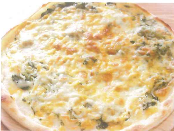
しらすに爽やかな香りのジェノベーゼソースが最高 しらすのジェノベーゼ 1,400円(税込) (税抜価格 1,297円)