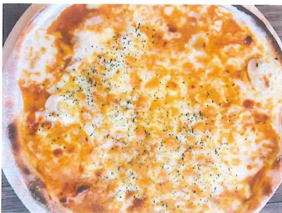
チキンの旨味を効かせた本格絶品カレーピザ バターチキンカレー 1,500円(税込) (税抜価格 1,389円)