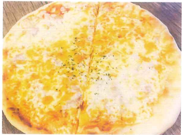
キッズの定番大好きなツナ&コーン ツナ&コーン 1,300円(税込) (税抜価格 1,204円)