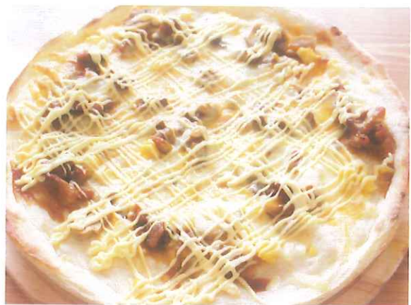
和風テリヤキ&マヨネーズが絶妙なバランス テリヤキマヨチキン 1,400円(税込) (税抜価格 1,297円)