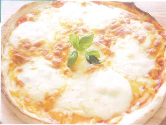
定番トマトソースにモッツアレラチーズとバジル マルゲリータ 1,300円(税込) (税抜価格 1,204円)