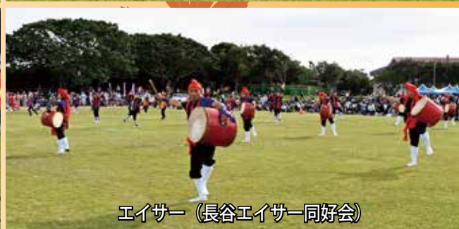
エイサー（長谷エイサー同好会）