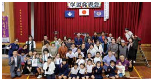
創立記念集会・学習発表会