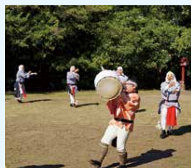
10/26（日） 荃永地区（宝満神社）