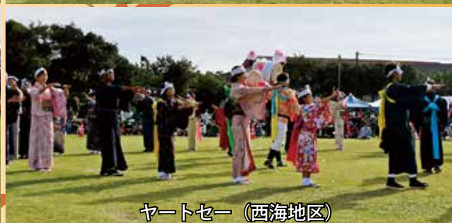
ヤートセー（西海地区）