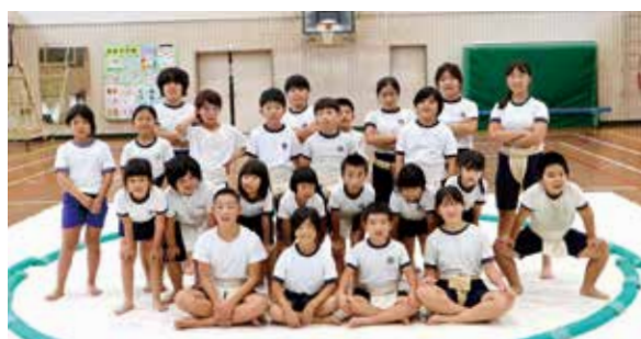
校内すもう大会 ～押して！引いて！技と力の大激突！～