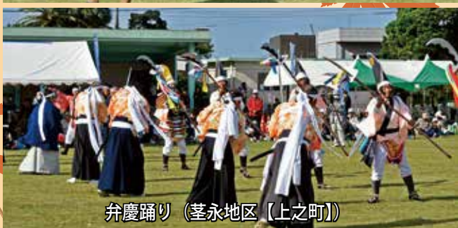
弁慶踊り（荃永地区【上之町】）