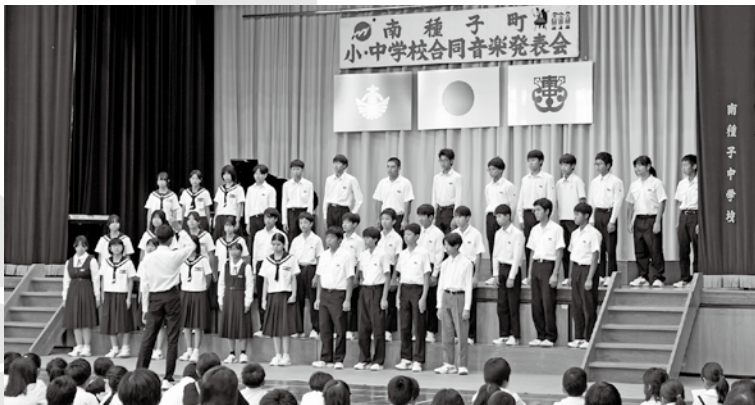
〈南種子中学校2年生による合唱〉