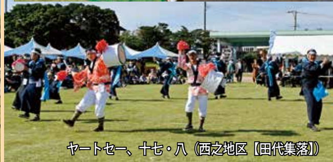
ヤートセー、十七・八（西之地区【田代集落】）