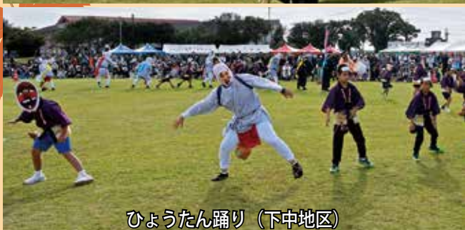
ひょうたん踊り（下中地区）