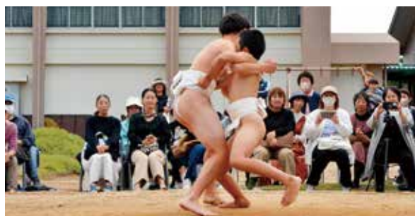
西野フェスティバル 白熱の校内相撲大会