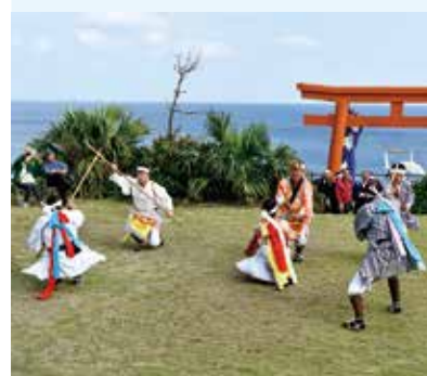
11/2（日） 西之地区（御崎神社）