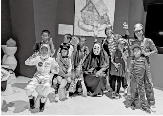
〈みんなと一緒に記念撮影〉