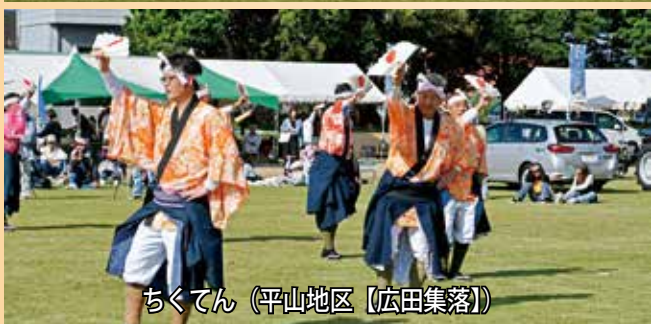
ちくてん（平山地区【広田集落】）