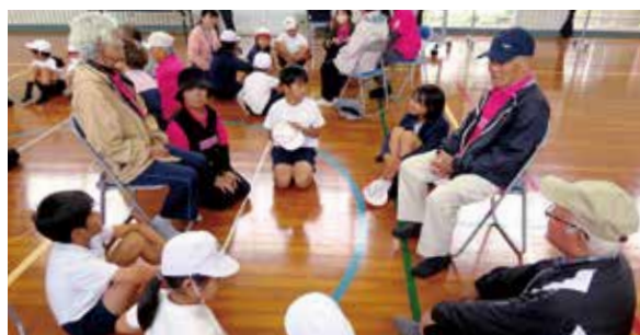
高齢者とのふれあい活動 クイズ大会をして昔のことを教えてもらいました♪