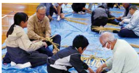
高齢者とのふれあい活動(5・6年生) 「しめ縄づくり」