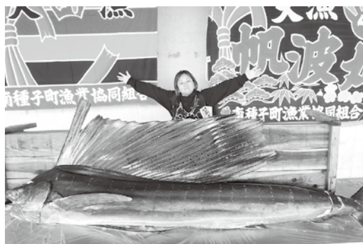
ふるさと祭りお魚重量当てクイズ！ ジャンボフィッシュと一緒に

な人の想いや活動を発信し、応援する人でありたいと思っています。まだまだ直接ご挨拶できていない方も多いですが、町の色々な所に出回っていますので、よろしくお願いたします。 発信はおもにInstagramとフェイスブックで行っており、こちらのチェックしただけいたら嬉しいですよ！