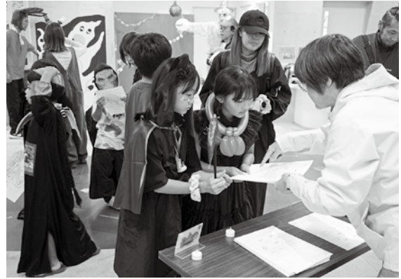
〈皆さん仮装をして参加〉