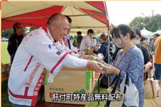
肝付町特産品無料配布