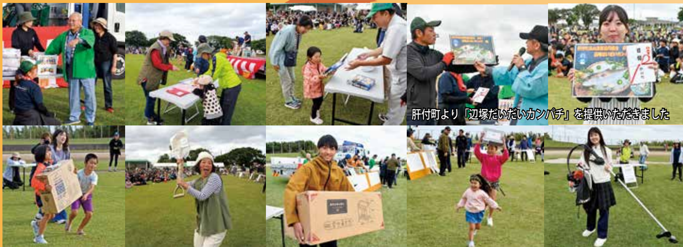
肝付町より「辺塚だいたいカンパチ」を提供いただきました