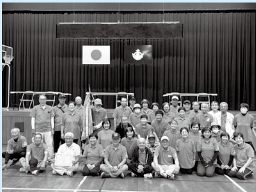
優勝：南種子老人クラブ連合会

10月21日（火）に熊毛ブロック老人スポーツ大会が南種子町において開催されました。当日はあいにくの雨となり、南種子町農業者トレーニングセンターでの開催となりました。大会には南種子町142人、中種子町から63人、西之表市から66人、総勢271人の会員の方々が一堂に会し、玉入れやボール運びリレー、マスゲーム、1ゲート通しなどの競技が行われ、けがもなく、楽しい時間を過ごされました。優勝は南種子老人クラブ