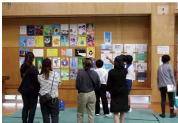
学習発表会 展示作品見学