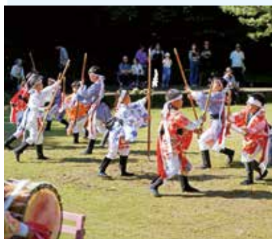
10/26（日） 荃永地区（宝満神社）

南種子町では、旧暦の9月、春に願立てした豊作が秋になって成就したことを感謝する秋季大祭（願成就祭）が行われます。今年も町内各地で開催され、人口減少の影響により踊り子の確保が難しい状況ではありますが、神事とともに各地域で伝承されている踊りが奉納され、見学に来られた多くの方々から大きな拍手が送られました。