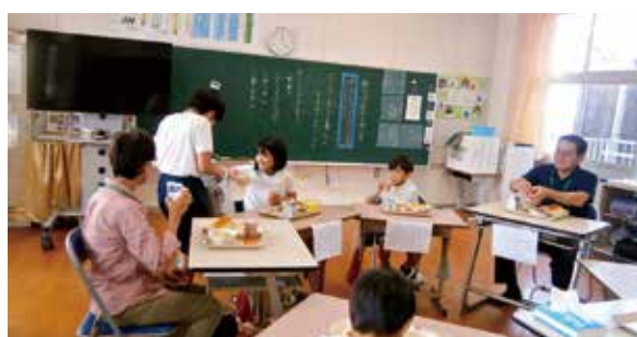
学校評議員の皆さんと給食の試食会