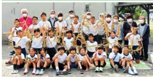
「高齢者との交流学习 ～昔の遊び・しめ縄づくり～」