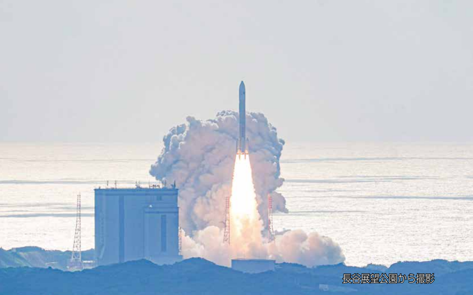
長谷展望公園から撮影