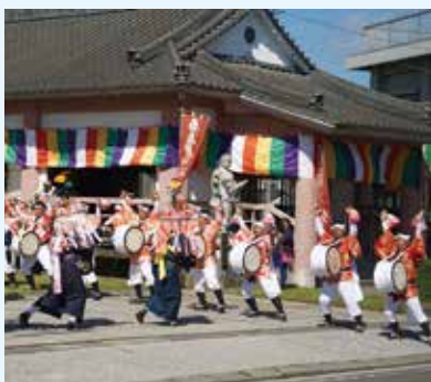
10/26（日） 上中地区（信光寺）