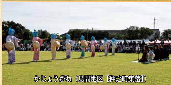
かじょうがね（島間地区【仲之町集落】）