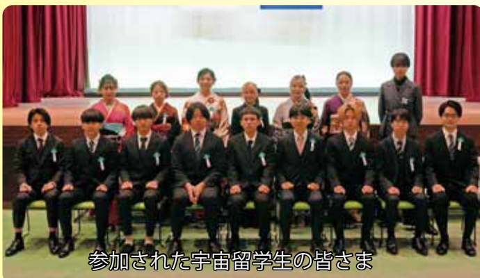
参加された宇宙留学生の皆さま