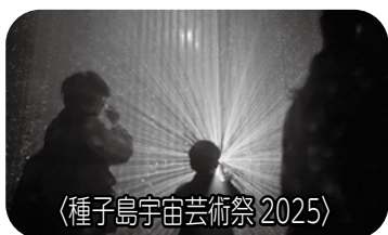
〈種子島宇宙芸術祭 2025〉

AT Crew（種子島宇宙芸術祭ボランティア）よりご参加ください。 ①コード：sattane ②ニックネーム：氏名（漢字フルネーム）をご入力ください ③最初に必ず、ノートに投稿してある使用方法をご確認ください。 一緒に楽しみながらイベントを作っていきましょう！お待ちしております！