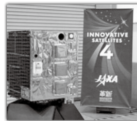
小型実証衛星4号機