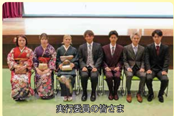
実行委員の皆さま