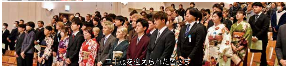
二十歳を迎えられた皆さま