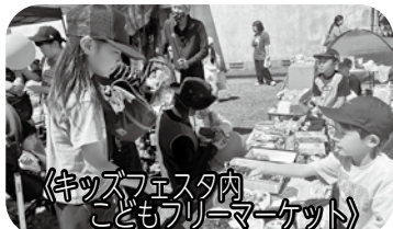
〈ギッズフェスタ内 こどもフリーマーケット〉