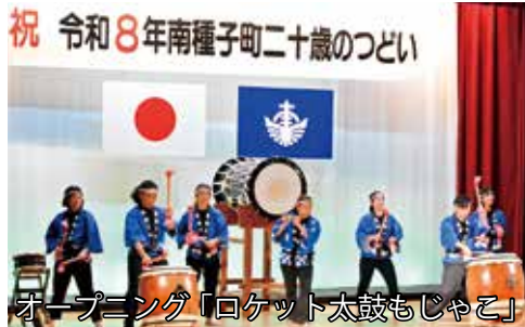
祝 令和8年南種子町二十歳のつどい オープニング「ロケット太鼓もじゃこ」