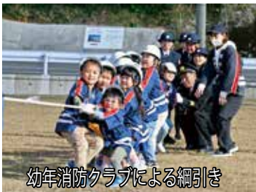
幼年消防クラブによる綱引き