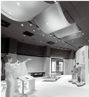
〈広田遺跡ミュージアム 展示室〉