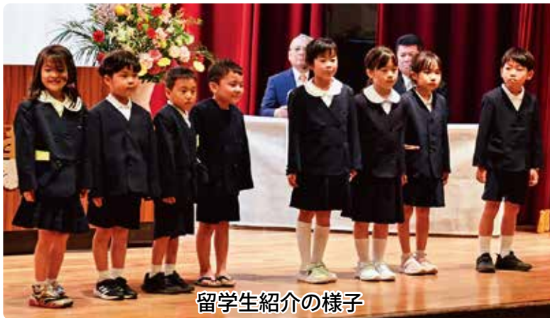
留學生紹介の様子

留學生の皆さんが、南種子町でしかできない多くの経験をjして、実り多い1年になることを期待します。