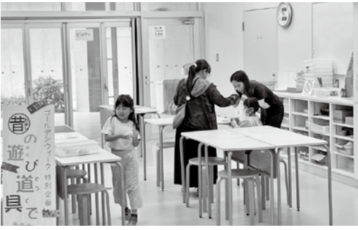
〈昨年度の「むかしのあそびひろば」の様子〉