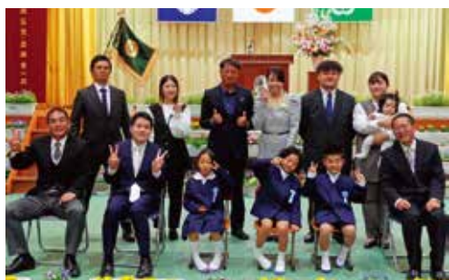
島間小に元気いっぱいな3人のメンバーが加わりました。 〈島間小学校〉