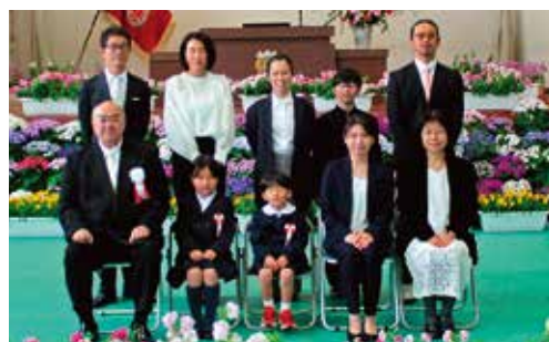
2人の入学生です。2人力を合わせて頑張ります！ 〈大川小学校〉