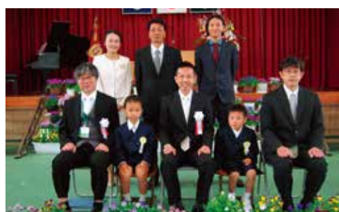
かわいい新入生2人と楽しい学校生活を送ります！ 〈長谷小学校〉