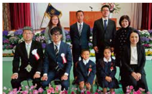
小学校生活にわくわく・にこにこやる気いっぱいの新1年生2名が入学しました！〈平山小学校〉