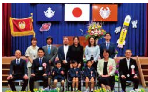
明るくパワフルな3人が仲間入り！式での姿、とても立派でした。 〈荃南小学校〉