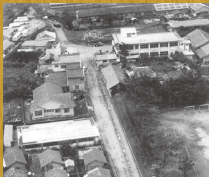
昭和30年代の上中地区（農協付近）の町並み奥に木造の南種子高校、左上に種子島交通上中営業所が見える。

今私たちが暮らす上で欠かせないインフラは、かつての住民や役場の協力と努力の上になりました。