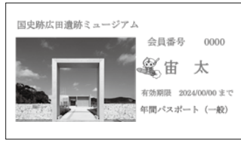
〈広田遺跡ミュージアム 年間パスポート〉