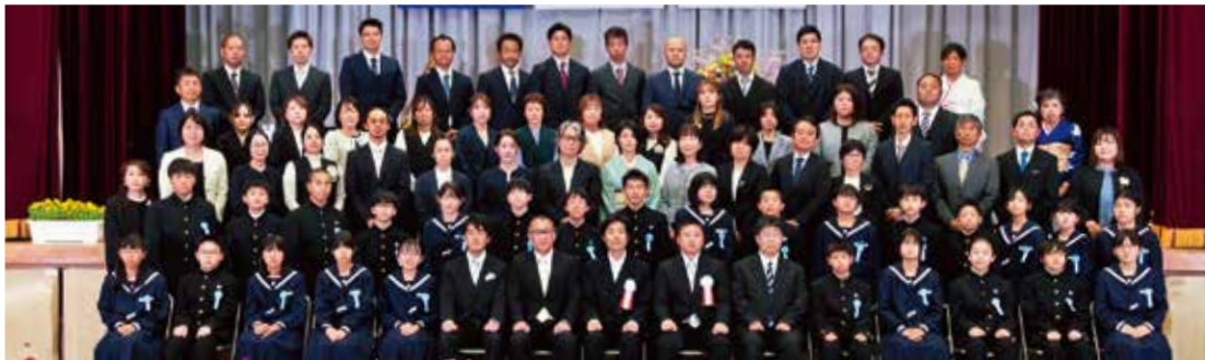
令和8年度南種子中学校新入生1年2組 〈南種子中学校〉