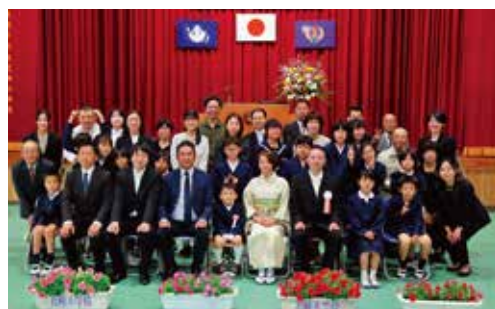
かわいい1年生1人を迎え、花峰っ子13人でのスタートです！〈花峰小学校〉