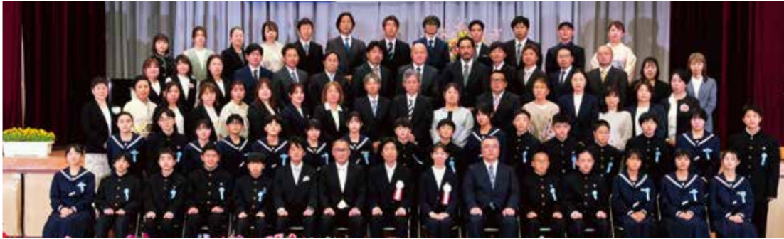
令和8年度南種子中学校新1年生1組 〈南種子中学校〉