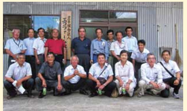
先進地研修：伊佐市「エコファーム永池」

平成 23 年 8 月 30 日、鹿児島市において、1 市 3 町の農業委員及び農業委員会職員による「熊毛地区農業委員研修会」を開催し、農業者年金の加入推進、農地法、耕作放棄地の解消に向けた取り組み等について説明があり、その後、意見交換が行われました。翌 31 日は、伊佐市の「農事組合法人エコファーム永池」と「藤井建設」を訪問し、高齢化対策に向けた永池集落営農法人組合の取り組みや、遊休農地荒廃地対策の取り組み状況等について研修しました。